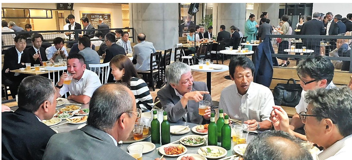
愛知県同窓会の皆様

また、今年にはリオデジャネイロオリンピックが開催され日本体育大学の現役学生・OB・OGの卒業生総勢28名が各競技で金メダルを目指して頑張ってくれると思います。今年の夏は熱く長い日々が続きますが応援頑張りたいと思います。