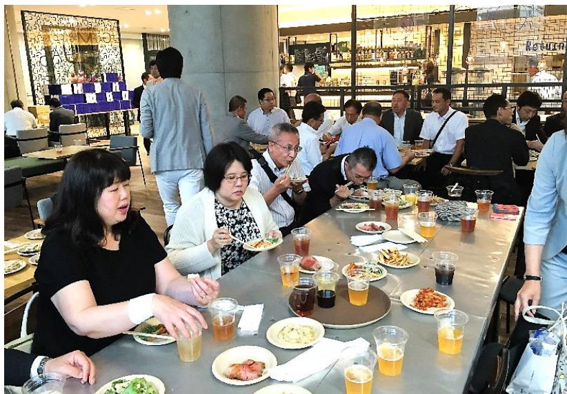
保護者とファンクラブ愛知の会の皆様

7月9日(土)の名古屋場所初日が迫るなか、日体大出身力士の激励会に出席いたしました。会場となった名城大学の新キャンパスに初めて行きました、キャンパス内とは思えないほどのレストランでした。天井が高く広々として壁は太陽の光が十分に入り込むガラスとなっていて素晴らしい会場でした。