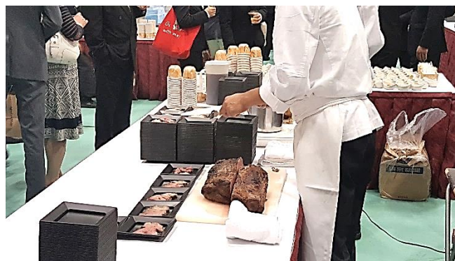
ローストビーフのコーナー