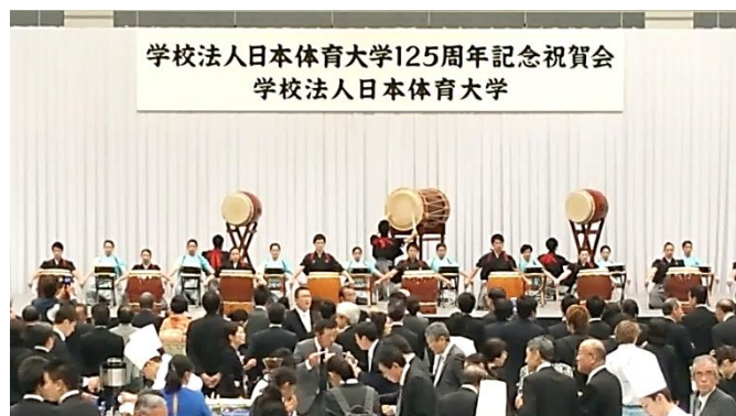
伝統芸能の実演発表

途中、部活動等の実演発表が幾つかあり、楽しませていただきました。また、「日体体操」の紹介も兼ねて会場内全員で体操をし（お土産で DVD も頂きました）、実演発表最後に応援団リーダー部がエールを送ってくださいました。