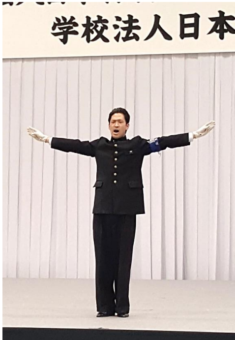
応援団 リーダー部